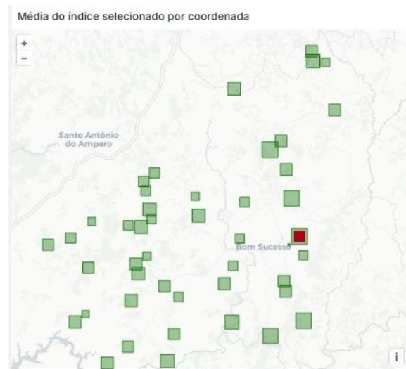
Figura 1 - Mapa representando os índices por pixel analisado.

O mapa interativo (Figura 1) mostra a distribuição espacial dos pixels analisados, permitindo visualizar o valor médio dos índices por coordenada no período selecionado. Ao escolher uma coordenada, o pixel é destacado em vermelho e todas as visualizações são ajustadas para aquela área. O gráfico de linhas (Figura 2) apresenta a evolução temporal de NDVI e EVI (2023–2024), com possibilidade de isolar cada índice na legenda.