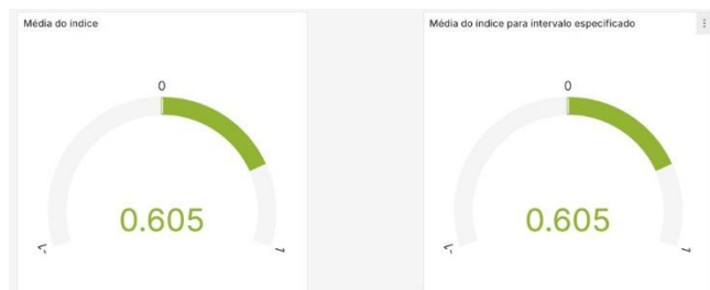
Figura 3 - Visual dos medidores.

interpretação dos índices vegetativos e amplia a compreensão das condições das lavouras ao longo do tempo.