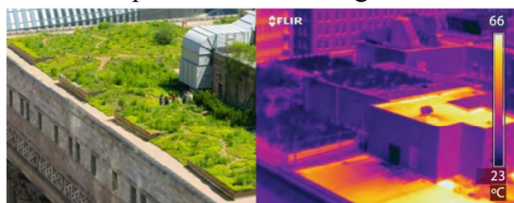
Figura 2: Comparação da temperatura da parte de um telhado coberto por vegetação e a parte sem cobertura verde na prefeitura de Chicago.

Chagas e Calheiros (2023) evidenciaram, por meio de modelagem no software SWMM, que o uso de coberturas verdes em 75% de um loteamento urbano pode reduzir a vazão de pico de escoamento superficial em até 60%, contribuindo para a prevenção de alagamentos e enchentes. Almeida (2018) ilustra o impacto térmico desses sistemas ao registrar que a superfície de concreto exposta em um telhado atinge 66 °C, enquanto áreas com vegetação se mantêm próximas a 23 °C, como mostrado na Figura 2.