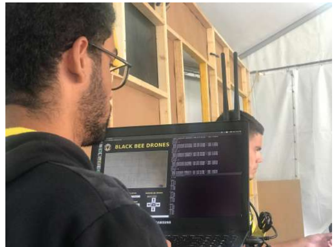
Figura 3 – Uso da plataforma na competição

A escolha da ferramenta ROS para o desenvolvimento da interface possibilitou que algoritmos complexos como os de visão computacional escritos em C++ se comunicassem diretamente com a interface desenvolvida em Python, trazendo uma gama quase ilimitada de possibilidades de missões que poderiam ser realizadas.