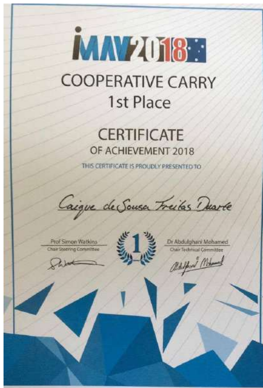
Figura 4 - Imagem do certificado de primeiro lugar na competição 2018 em Melbourne - Austrália