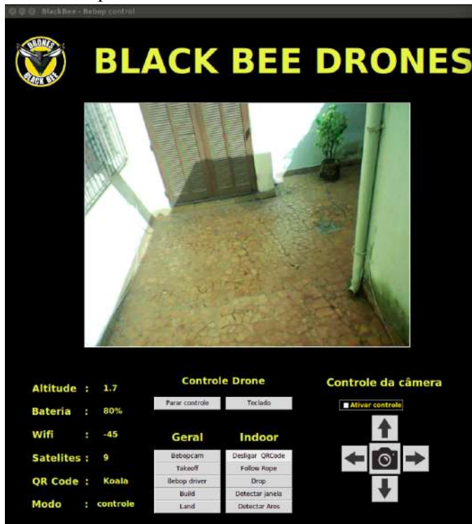
Figura 2 - Interface gráfica desenvolvida

A plataforma ficou funcional a tempo para a participação da equipe na edição 2018 da competição e foi utilizada para a realização das provas. O resultado final está representado abaixo.